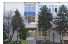
Colegiul Național "Mihai Eminescu" Baia Mare, printre cele 87 de unități declarate câștigătoare în 2019

Unitățile de învățământ din Maramureș se pot înscrie și în acest an școlar în competiția pentru obținerea certificatului „Școală Europeană”, organizată de Ministerul Educației și Cercetării. Competiția se adresează tuturor unităților de învățământ preuniversitar care au fost și sunt implicate în programele europene din domeniul educației și formării profesionale. Odată obținut, certificatul „Școală Europeană” este valabil pentru o perioadă de trei ani, după care școala trebuie să candideze din nou pentru a reconfirma titlul obținut.