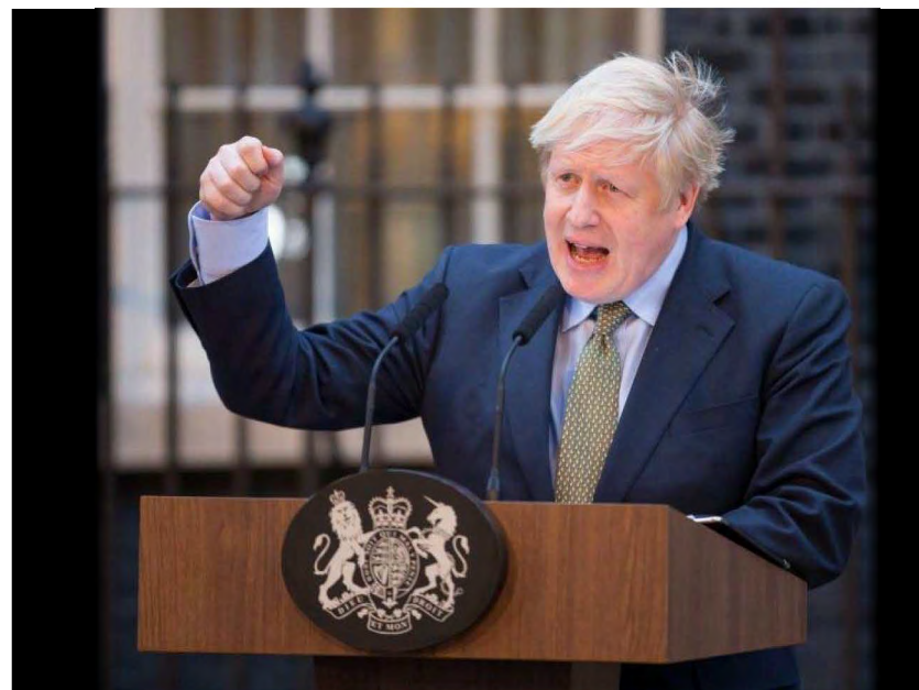
Prime Minister Boris Johnson makes his first speech on the doorstep of number 10. Prime Minister Boris Johnson In Downing Street, London, UK - 13 Dec 2019, Image: 487963488, License: Rights-managed, Restrictions: Model Release: no