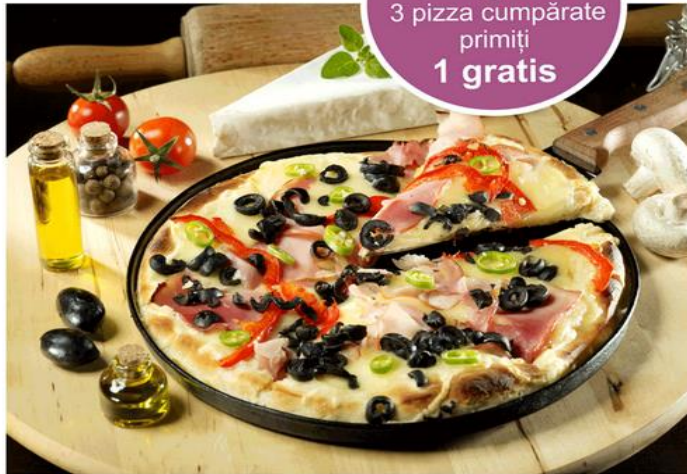
Orice sortiment, orice dimensiune!

Ofertă 3+1 gratis 3 pizza cumpărate primiți 1 gratis