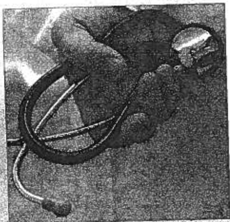
Asociației Medicilor de Familie din Maramureș.

Sunt invitați să participe medici de familie, membri ai