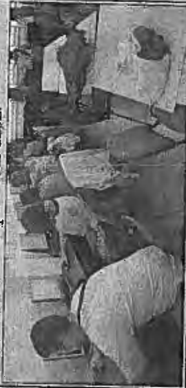
Pagină realizată de Anca Dindiligan

Instituțiile de învățământ din Maramureș care doresc să se înscrie la acest eveniment o pot face până în data de 30 noiembrie. Conform reprezentanților Inspectoratului Școlar Județean Maramureș, în campanie se pot înscrie și licee din UE, cu condiția de a îndeplini mai multe condiții: să aibă un com-