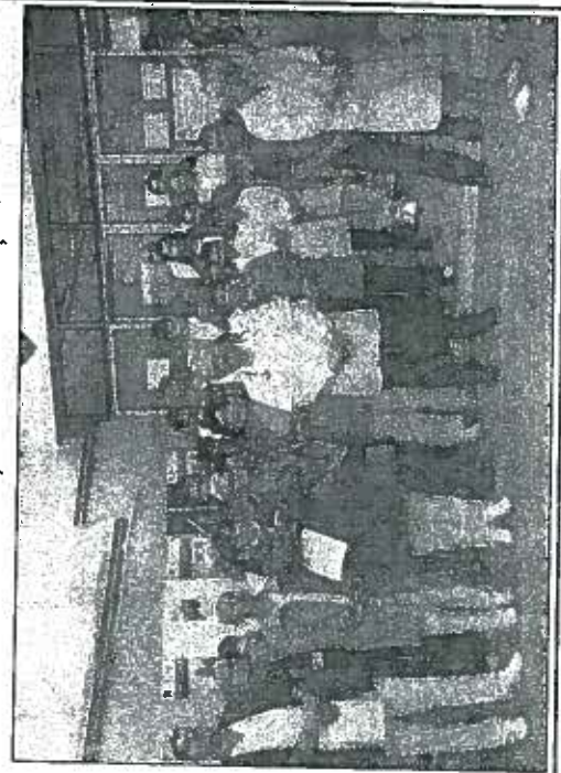
Pagină realizată de Călin Dragomir

în urma negocierilor se referă la o suplimentare a fondurilor care urmează să fie virate către sistemul public de sănătate. Au fost alocaţi pentru finele acestui an 200.000 lei din fondul de rezervă al Guvernului pentru plata la timp al salariilor angajaţilor din sănătate, fapt ce a dus şi la o creştere timidă a procentului din PIB alocat acestui sistem. Respectiv, dacă în anul 2012, pentru sănătate au fost alocate 3.8% din PIB, în 2013 procentul este de 4,2%, urmând ca în 2014 acesta să ajungă la 4,5% iar până în 2016 la 6%, atât cât îşi doresc sindicaliştilor.