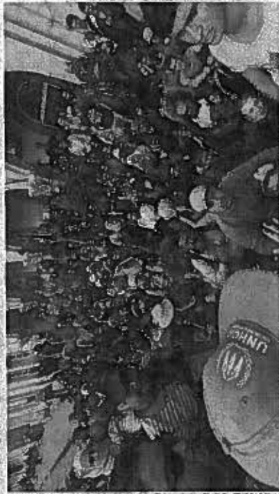
sandviciul pe care ni le-au dat".

Uniunii, a comentat la Bruxelles Natasha Bertaud, o purtătoare de cuvânt a Comisiei Europene (CE). Gestul Berlinului "constituie o recunoaștere a faptului că nu putem lăsa statele membre situate la frontierele externe să gestioneze singure" aflulul excepțional de imigranți, ca în cazul Greciei sau Italiei, a continuat Bertaud. "Europa se află într-o situație care nu este demnă de Europa, trebuie să o spunem pur și simplu", a decla-