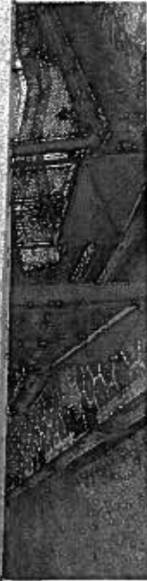
Clădirea Protopopiatului din Tg. Lăpuș

numirii cu numărul 131681 din 22.01.2014, eliberată de Ministerul Justiției. Are personalitate juridică română, înființată conform OG 26/2000 și își