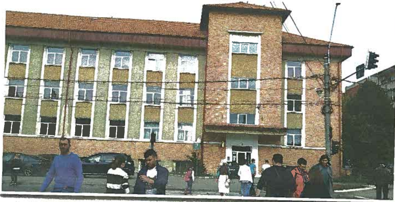
Citiți în PAGINA 3