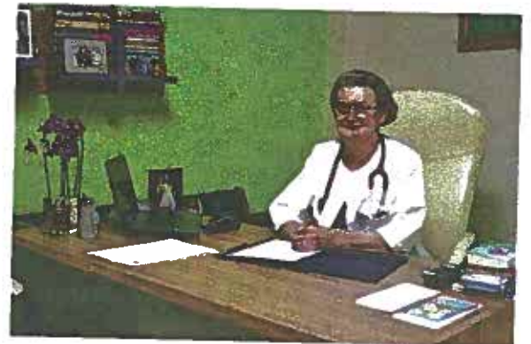
Citiți în PAGINA 3

deputat PNL de Maramureș: "Sustin sănătatea și nu renunț la meseria mea de medic"