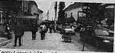
Centrul orașului Târgu Lăpuș

Ziua Națională a României se va marca în data de 8 decembrie, anul acesta, în orașul Târgu Lăpuș. Tot atunci, în Jozia Patimilor, autoritățile vor marca și comemorarea eroilor lăpușeni căzuți în 5 Decembrie 1918. Așa se întâmplă, de ani de zile în orașul Târgu Lăpuș, ca Ziua Națională a României să se sărbătorească în