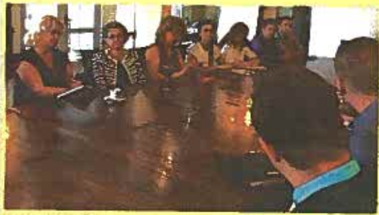
Citiți în PAGINA 3

„Economia românească este la un pas de faliment! De ce ucideți mediul privat?”