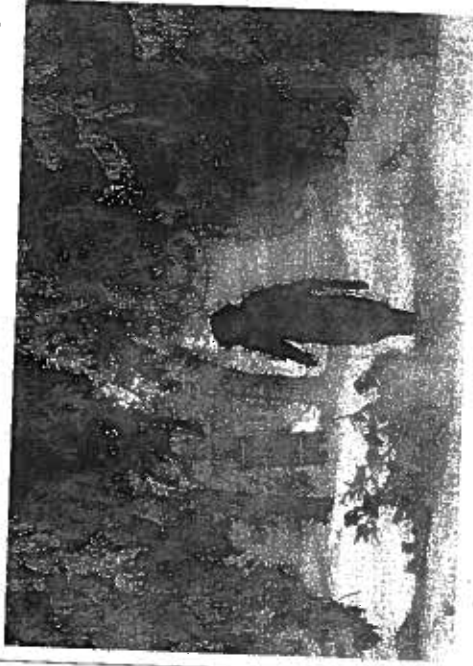
Potrivit prognozei, bazată pe calculul indicilor

larna care vine, conform prognozelor mai multor servicii meteorologice ruse, va aduce temperaturi anormal de scăzute în Europa și s-ar putea să fie chiar cea mai rece iarnă din ultimii 100 de ani, scrie joi ziarul rus Novâie Izvestia, citat de portalul Utro.