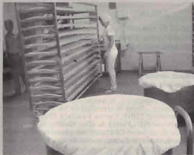
Pagină redactată de Nicolae GOJA

(www.afir.info). Prin intermediul sM 4.2, solicitanții pot obține sprijin financiar nerambursabil de 50% din totalul cheltuielilor eligibile pentru IMM-uri și forme asociative și de 40% pentru alte întreprinderi. Sprijinul acordat nu va depăși 1.000.000 euro / proiect pentru IMM, 1.500.000 euro / proiect pentru alte întreprinderi sau 2.500.000 euro / proiect pentru forme asociative (cooperative și grupuri de producători). În cazul investițiilor care conduc la un lanț alimentar integrat (indiferent de tipul de solicitant) finanțarea poate ajunge până la 2.500.000 euro / proiect. Documentația necesară solicitării fondurilor nerambursabile se întocmește conform Ghidului solicitantului și anexelor aferente acestuia, disponibile gratuit pe site-ul AFIR, la secțiunea „Investiții PNDR”, în pagina dedicată submăsurii 4.2.