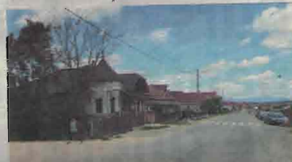
Calea Miresului - Șomcută Mare

140 de dosare de ajutor social în Șomcuta Mare