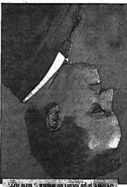
Unirea Europeană a devenit „prea mare”, precum un oraș prea mare, pentru membrii britanici David Cameron, solicitând UE să se concentreze pe

gertere și pe locuri de muncă”, scrie AFP.